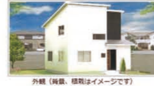
外観（背景、植栽はイメージです）