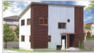
外観（背景、植栽はイメージです）