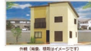
外観（背景、植栽はイメージです）