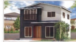
外観（背景、植栽はイメージです）